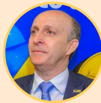
Glademir Aroldi Presidente da CNM

A pandemia do coronavírus já está mudando as práticas de gestão, as relações sociais, a economia e as perspectivas futuras nos nossos Municípios. A responsabilidade de conduzir os destinos das nossas comunidades, neste momento crucial, impõe-nos ação imediata, eficaz e eficiente junto aos diversos segmentos, com vista a minimizar os impactos negativos que com certeza serão gerados.