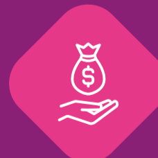
Avalista ou fiador

Não tem garantia? O Sebrae possui um fundo para avaliar o empréstimo dos pequenos e microempresários.