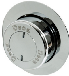
Imagem 09: Válvula para chuveiro fechamento automático acabamento cromado. Referências Deca , Roca , Docol ou superior.