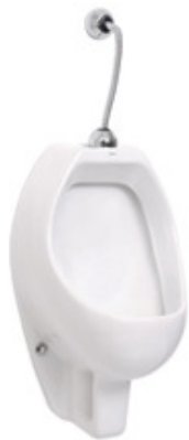
Imagem 03: Mictório com sifão integrado na cor branca. Referências Deca , Roca , Toto Brasil ou superior.

Imagem 02: Cuba de Apoio quadrada com mesa dim. 40x40 cm na cor branca. Referências Deca , Roca , Toto Brasil ou superior.