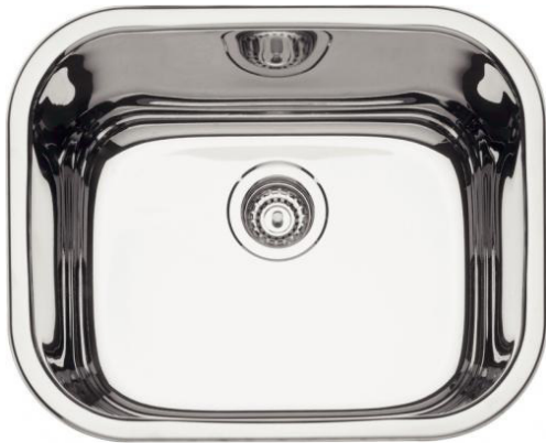
Imagem 05: Cuba retângula 40 BL, com acabamento polido dim. .40x.34x.16.