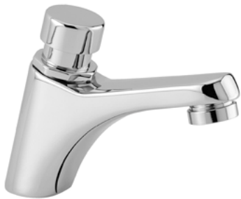
Imagem 07: Torneira para lavatório mesa fechamento automático, com arejador, acabamento cromado. Referências Deca , Roca , Docol ou superior.