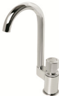
Imagem 06: Torneira para lavatório com bica alta mesa fechamento automático, com arejador, acabamento cromado. Referências Deca , Roca , Docol ou superior.