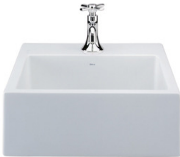
Imagem 02: Cuba de Apoio quadrada com mesa dim. 40x40 cm na cor branca. Referências Deca , Roca , Toto Brasil ou superior.

Bacia Sanitária com caixa acoplada com acionamento Dual Flux, linha linha Fast branca, inclusive com assento sanitário, na cor branca -Deca , Roca, Toto Brasil ou superior, com kit de instalação incluindo parafusos com acabamento cromado.