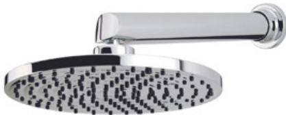
Imagem 10: Chuveiro em tubo de parede acabamento cromado. Referências Deca , Roca , Docol ou superior.