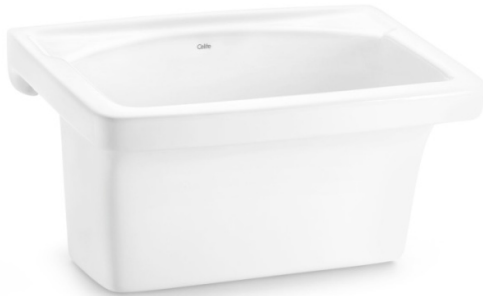
Imagem 04: Tanque em louça suspenso com capacidade para 30 litros na cor branca. Referências Deca , Roca , Toto Brasil ou superior.