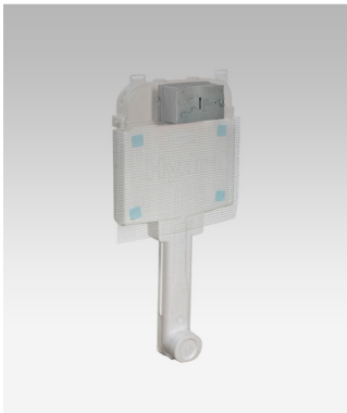
Imagem 13: Caixa de descarga embutida para alvenaria e drywall com acionamento mecânico . Referências Deca , Roca , Toto Brasil ou superior.