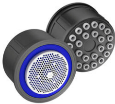
Imagem 08: Arejador 3,6 litros/mim spray. Referências Deca , Roca , Docol ou superior.