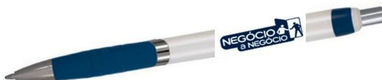
IMAGEM / LEIAUTE