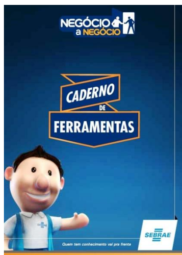
IMAGEM / LEIAUTE (CAPA)