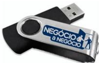
IMAGEM / LEIAUTE