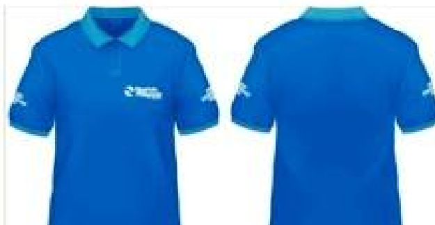
IMAGEM / LEIAUTE