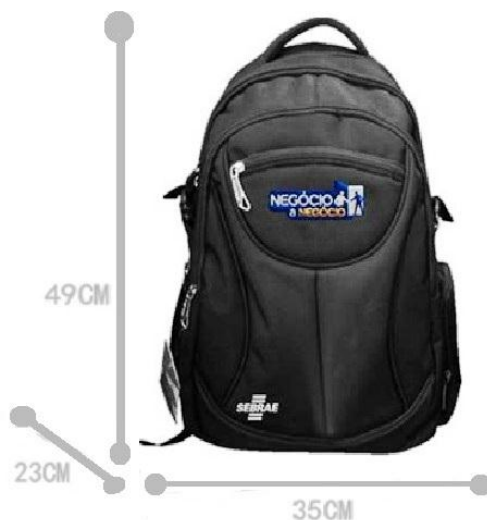
IMAGEM / LEIAUTE