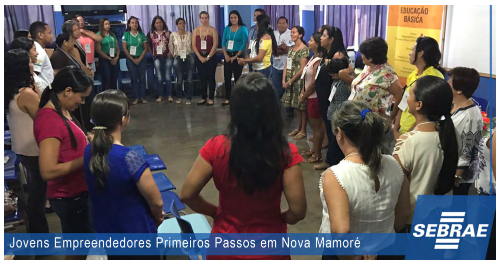
Jovens Empreendedores Primeiros Passos em Nova Mamoré