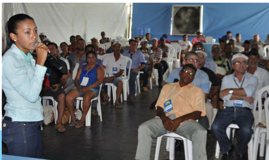
Público participa do Seminário Rural