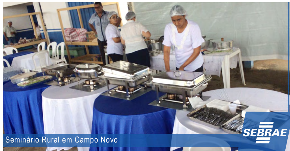
Seminário Rural em Campo Novo