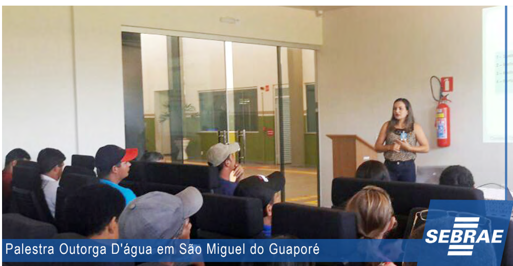
Palestra Outorga D'água em São Miguel do Guaporé