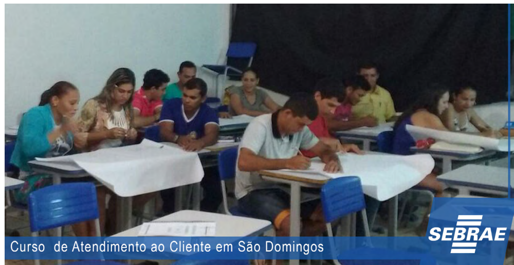
Curso de Atendimento ao Cliente em São Domingos