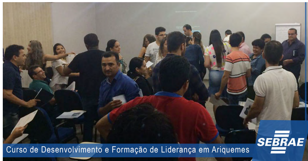
Curso de Desenvolvimento e Formação de Liderança em Ariquemes