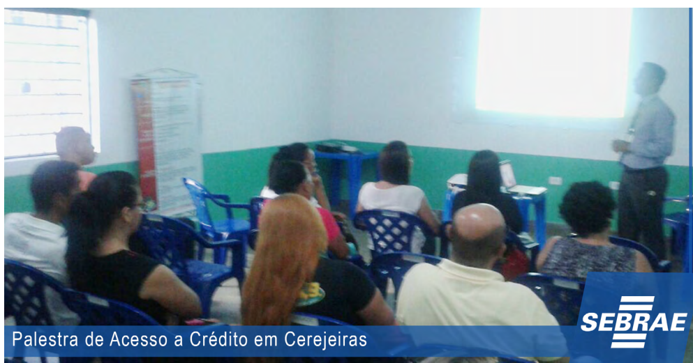
Palestra de Acesso a Crédito em Cerejeiras