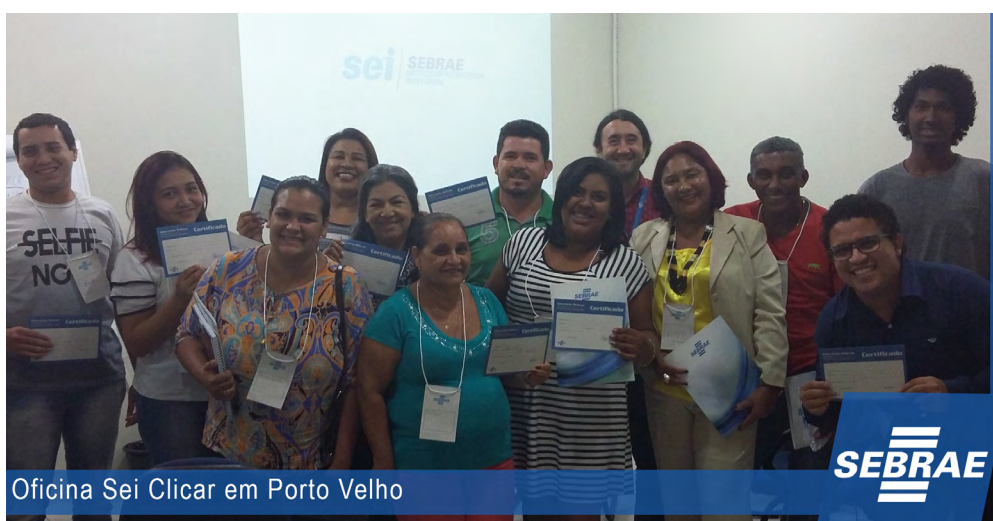
Oficina Sei Clicar em Porto Velho