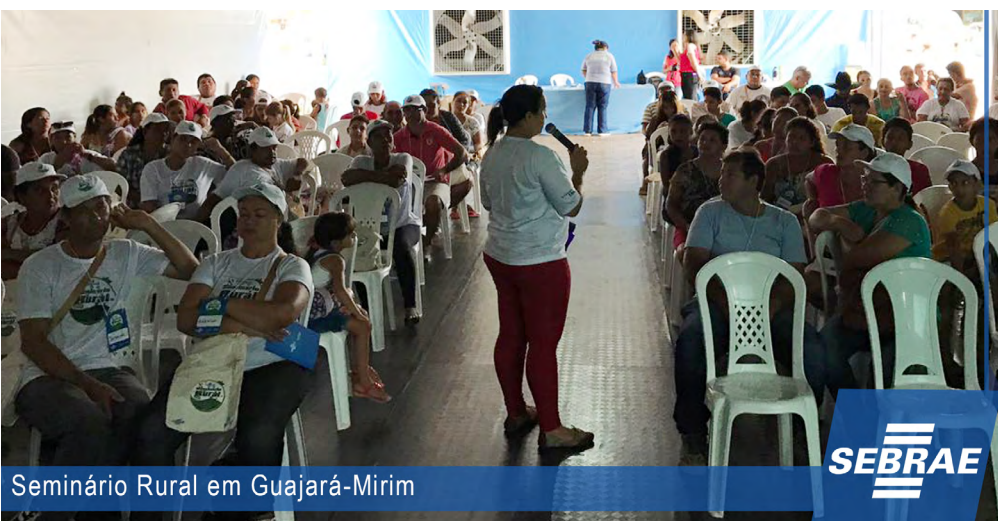
Seminário Rural em Guajará-Mirim