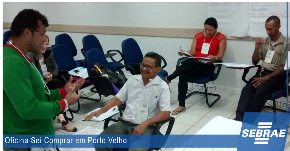
Oficina Sei Comprar em Porto Velho