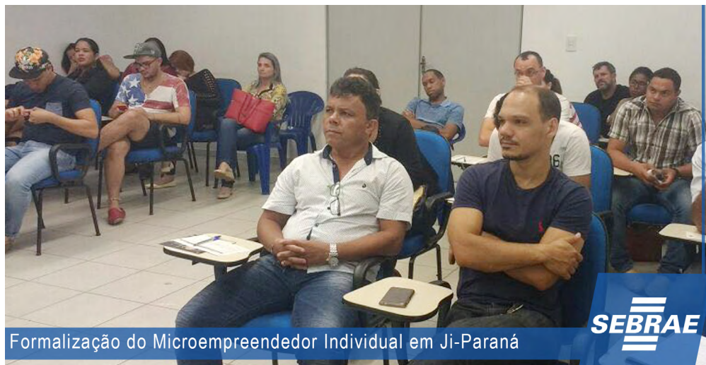
Formalização do Microempreendedor Individual em Ji-Paraná