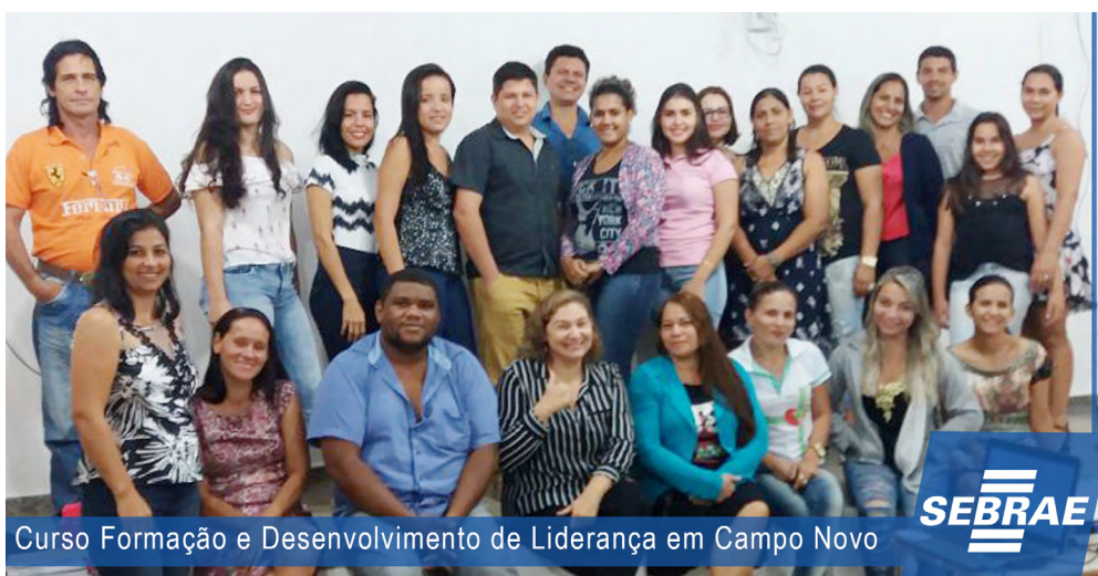
Curso Formação e Desenvolvimento de Liderança em Campo Novo