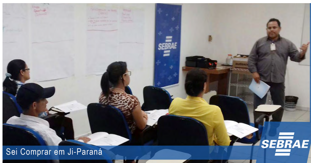
Sei Comprar em Ji-Paraná