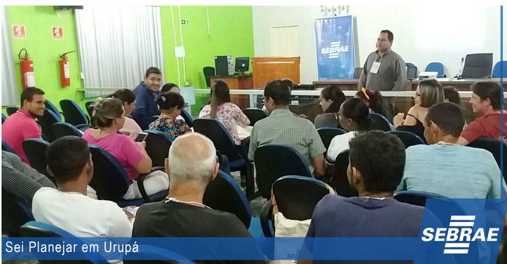
Sei Planejar em Urupá