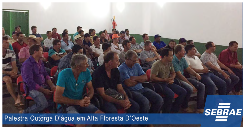
Palestra Outorga D'água em Alta Floresta D'Oeste