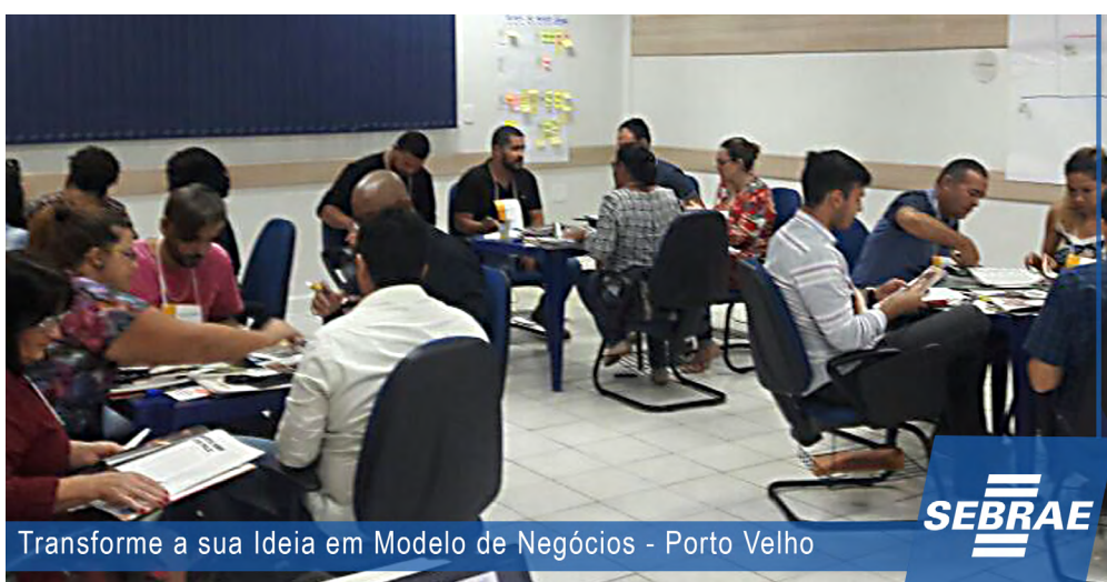
Transforme a sua Ideia em Modelo de Negócios - Porto Velho