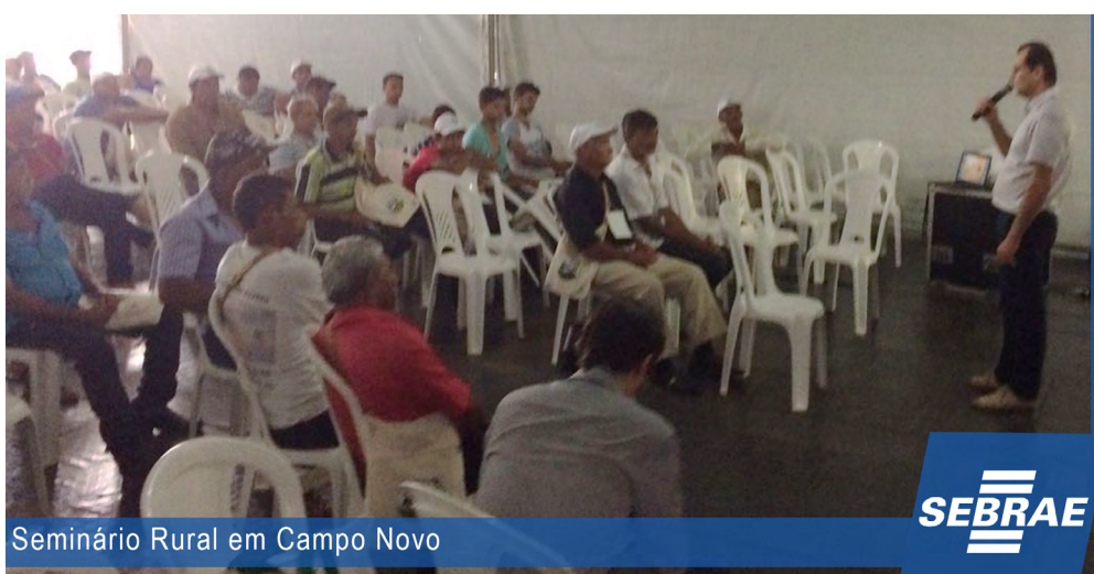
Seminário Rural em Campo Novo