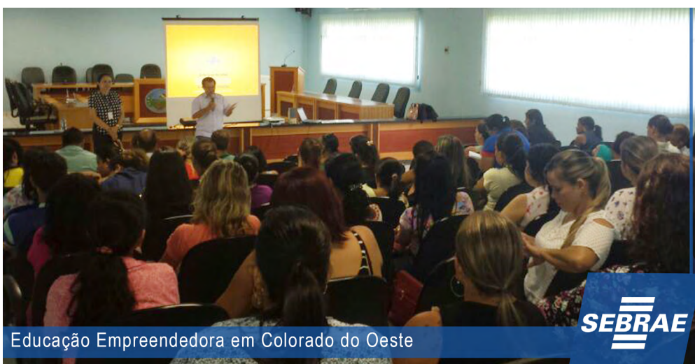
Educação Empreendedora em Colorado do Oeste