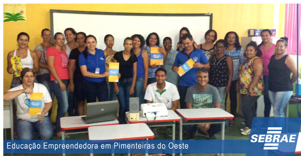
Educação Empreendedora em Pimenteiras do Oeste

Frase mais compartilhada em fevereiro no Facebook. Compartilhe agora mesmo a sua preferida.