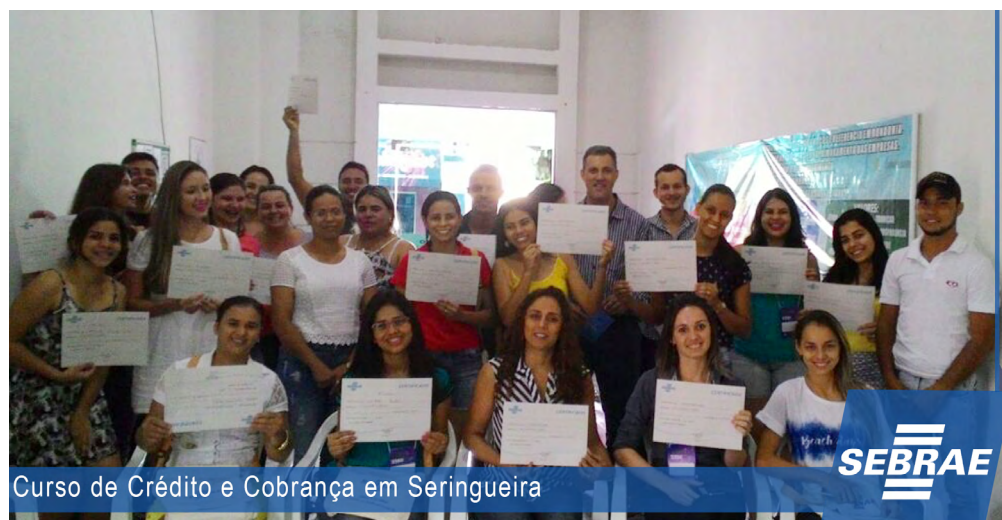
Curso de Crédito e Cobrança em Seringueira