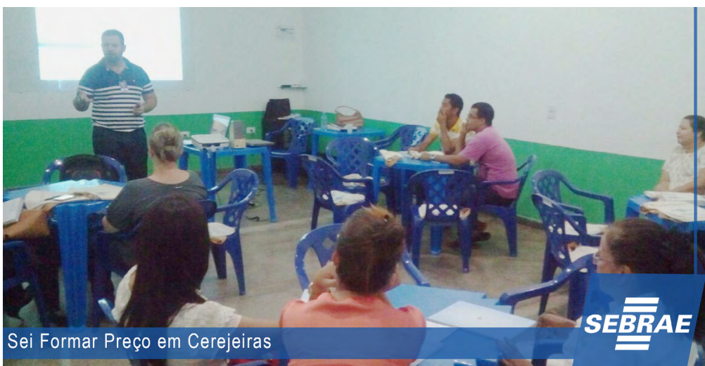
Sei Formar Preço em Cerejeiras