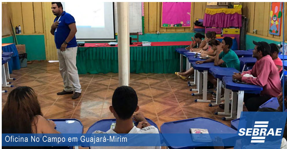
Oficina No Campo em Guajará-Mirim