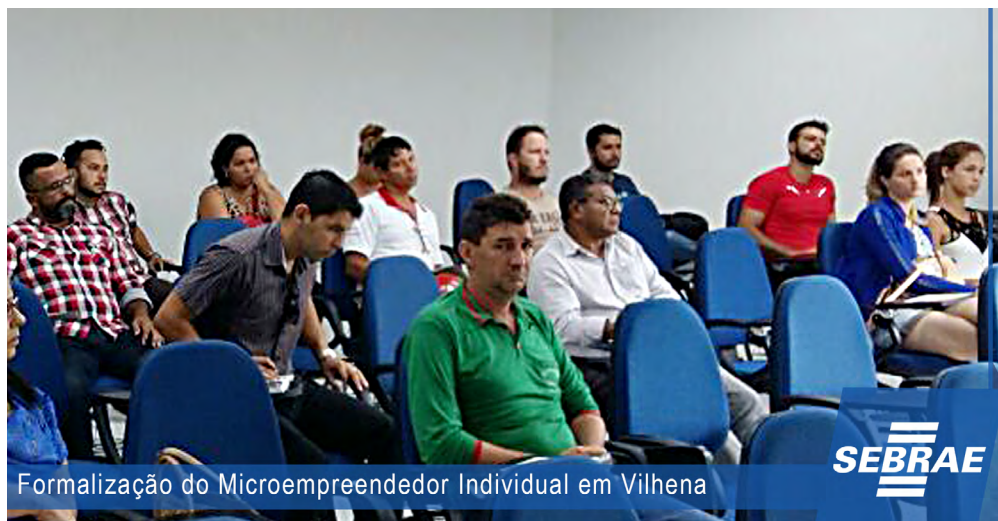
Formalização do Microempreendedor Individual em Vilhena