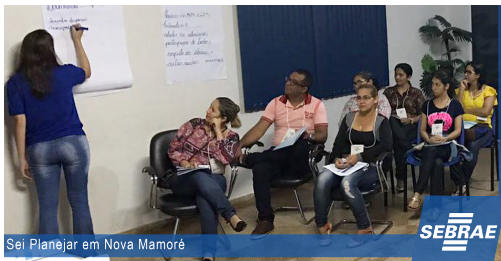
Sei Planejar em Nova Mamoré