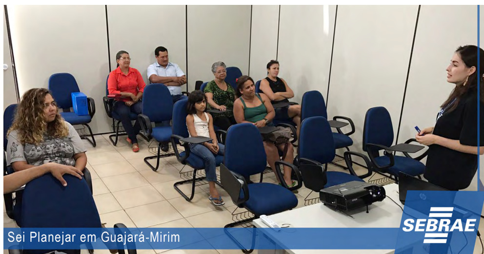
Sei Planejar em Guajará-Mirim