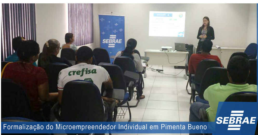
Formalização do Microempreendedor Individual em Pimenta Bueno