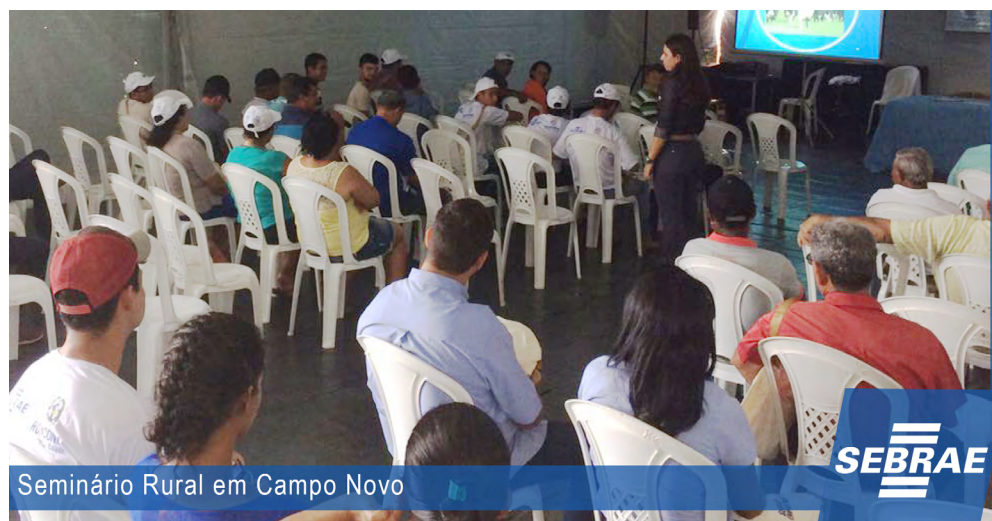
Seminário Rural em Campo Novo