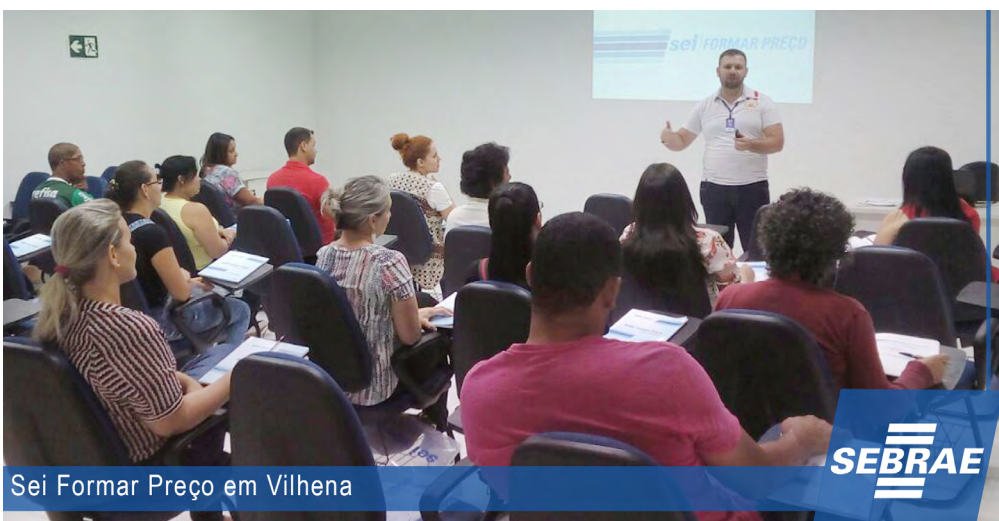
Sei Formar Preço em Vilhena