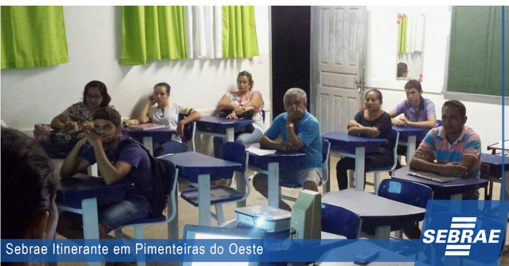
Sebrae Itinerante em Pimenteiras do Oeste