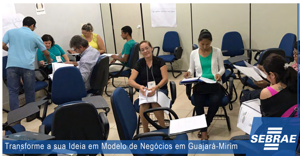
Transforme a sua Ideia em Modelo de Negócios em Guajará-Mirim