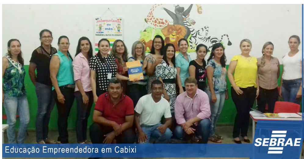
Educação Empreendedora em Cabixi