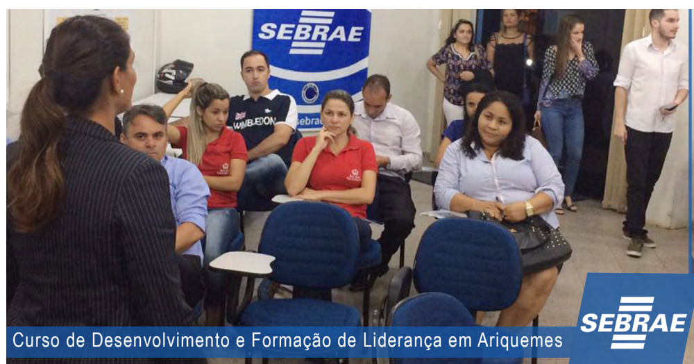
Curso de Desenvolvimento e Formação de Liderança em Ariquemes