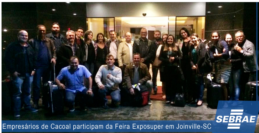
Empresários de Cacoal participam da Feira Exposuper em Joinville-SC