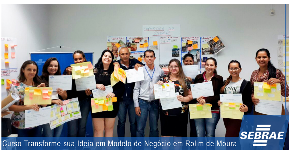
Curso Transforme sua Ideia em Modelo de Negócio em Rolim de Moura