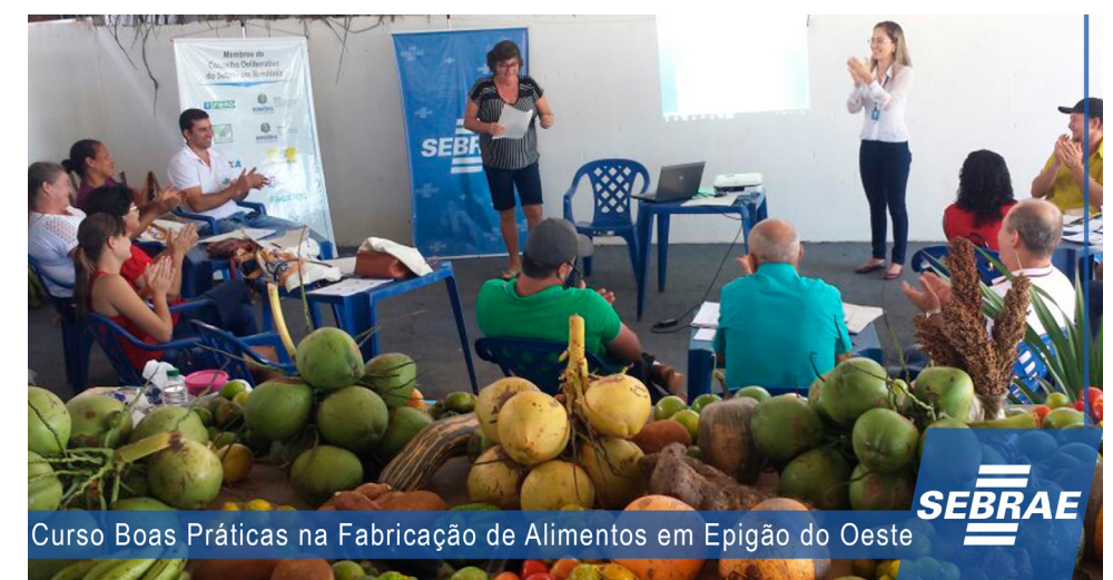
Curso Boas Práticas na Fabricação de Alimentos em Epigão do Oeste