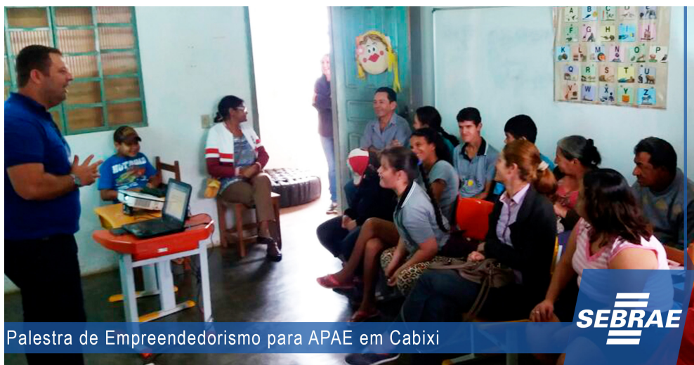
Palestra de Empreendedorismo para APAE em Cabixi