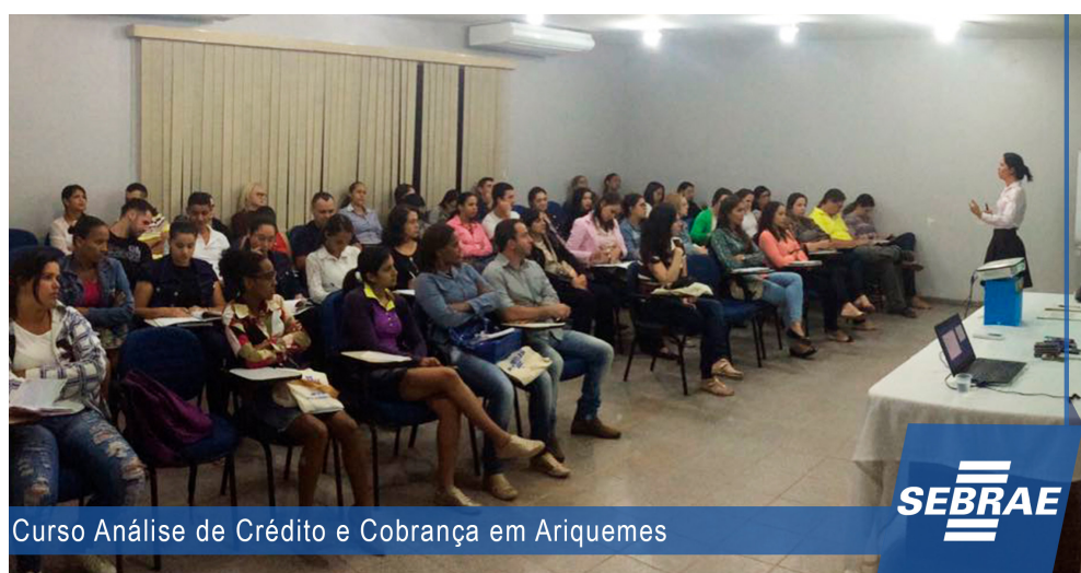
Curso Análise de Crédito e Cobrança em Ariquemes