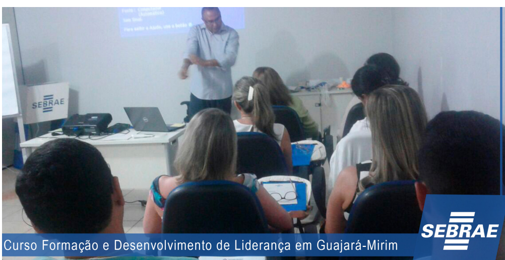
Curso Formação e Desenvolvimento de Liderança em Guajará-Mirim