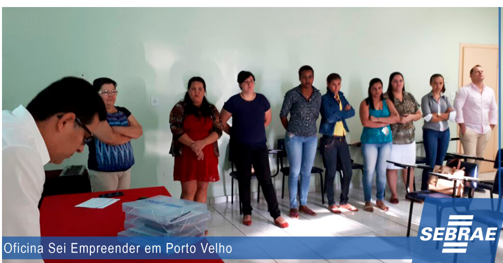
Oficina Sei Empreender em Porto Velho