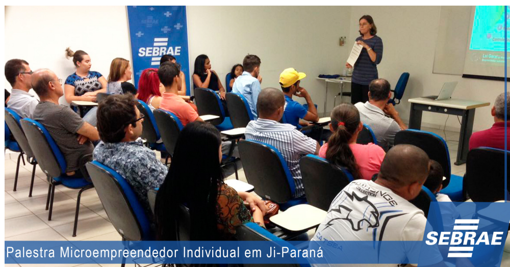
Palestra Microempreendedor Individual em Ji-Paraná