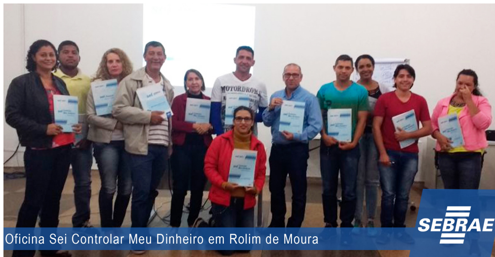
Oficina Sei Controlar Meu Dinheiro em Rolim de Moura