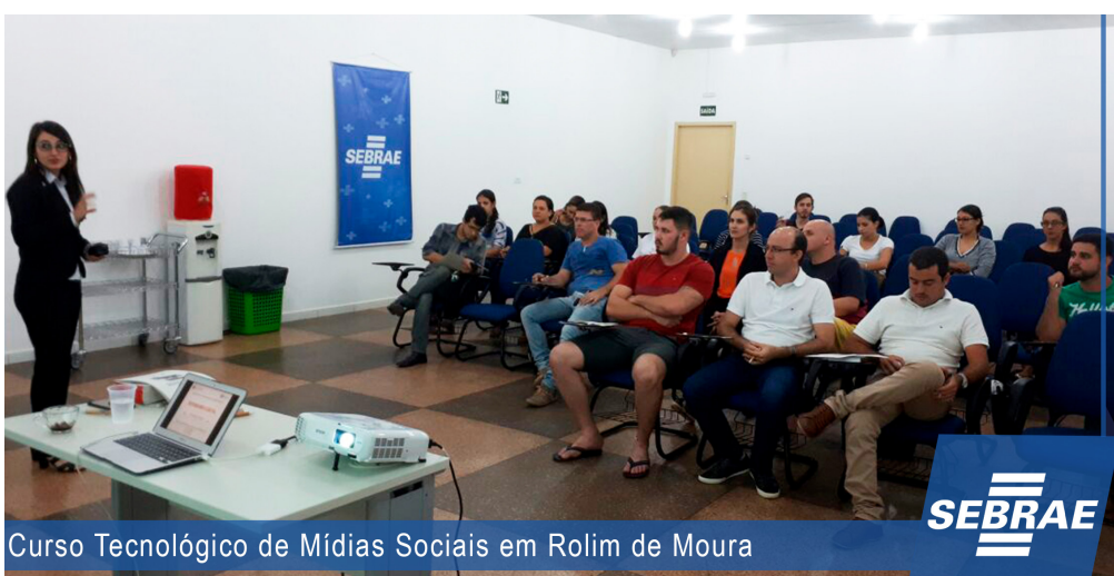
Curso Tecnológico de Mídias Sociais em Rolim de Moura