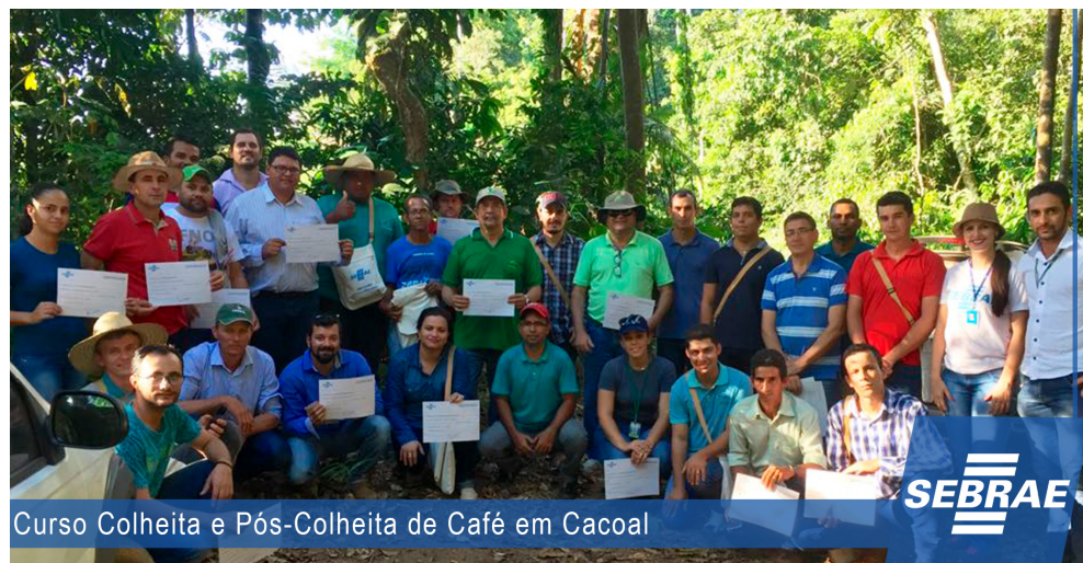
Curso Colheita e Pós-Colheita de Café em Cacoal