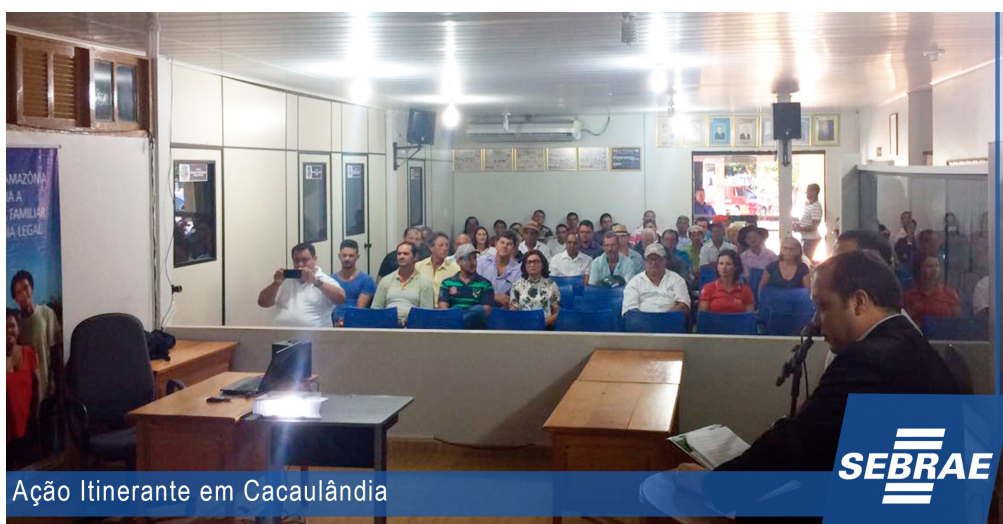
Ação Itinerante em Cacaulândia