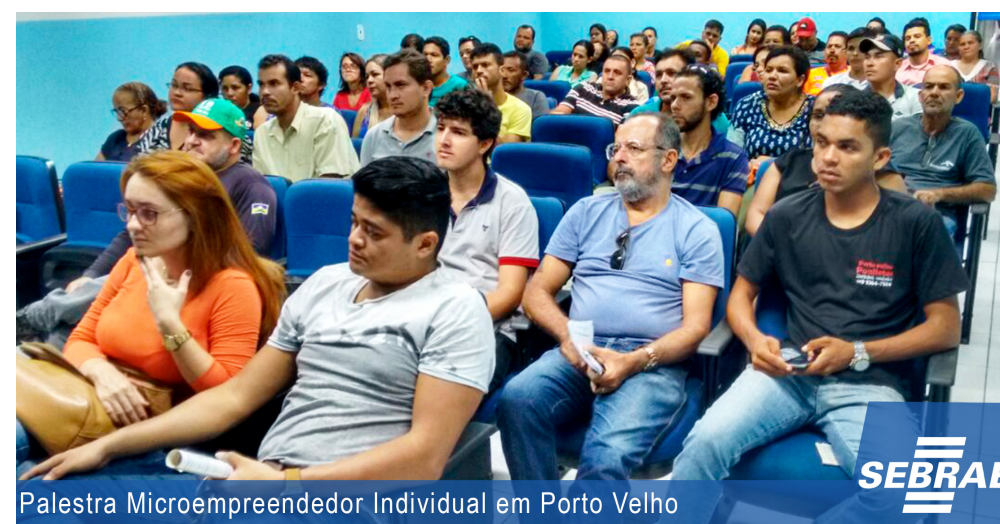
Palestra Microempreendedor Individual em Porto Velho