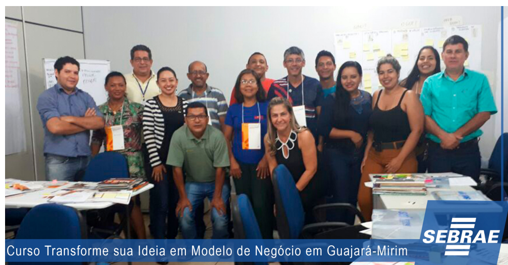
Curso Transforme sua Ideia em Modelo de Negócio em Guajará-Mirim