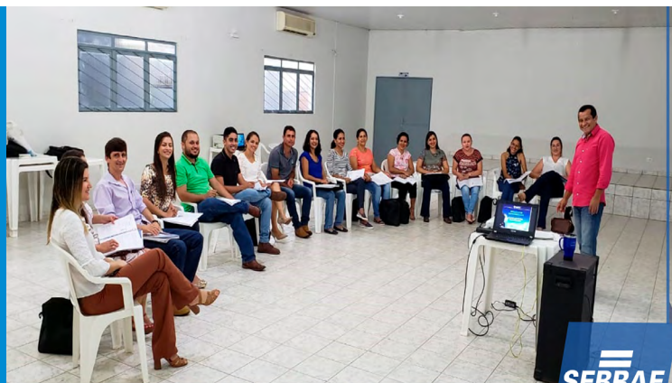
Empretecursos no Workshop 21 dias em Alta Floresta d'Oeste