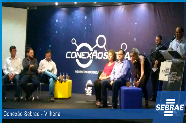
Conexão Sebrae - Vilhena