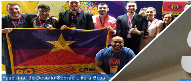
Fase final do Desafio Sebrae Like a Boss