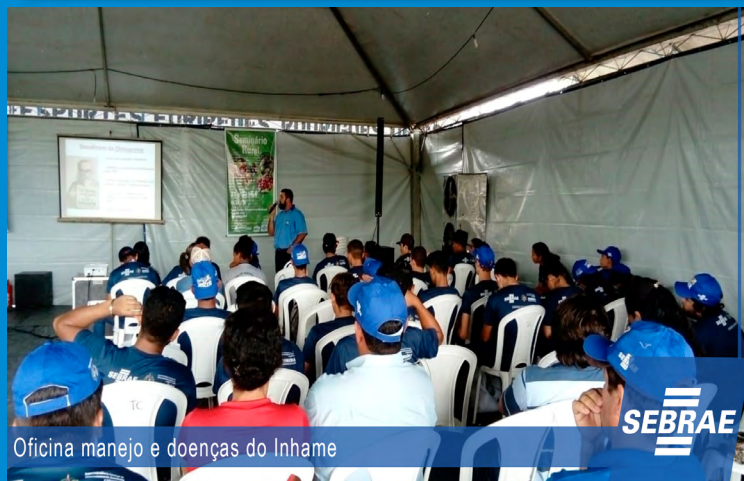
Oficina manejo e doenças do Inhamé