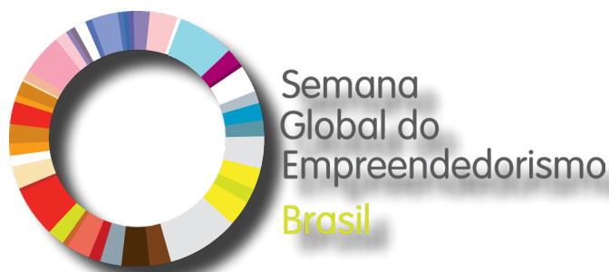
Semana Global do Empreendedorismo Brasil

atividades em todo país. Mulheres, Inclusão Social e Inovação foram os temas escolhidos para nortear a semana, que visa conectar, capacitar e inspirar o público a transformar ideias em iniciativas de sucesso. O presidente do Sebrae, Guilherme Afif Domingos, celebra a realização da iniciativa: "Os jovens estão fazendo grandes mudanças nas formas de empreender, criando.