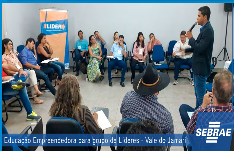
Educação Empreendedora para grupo de Líderes - Vale do Jamari