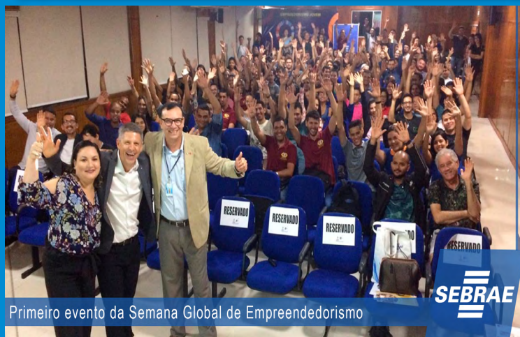
Primeiro evento da Semana Global de Empreendedorismo