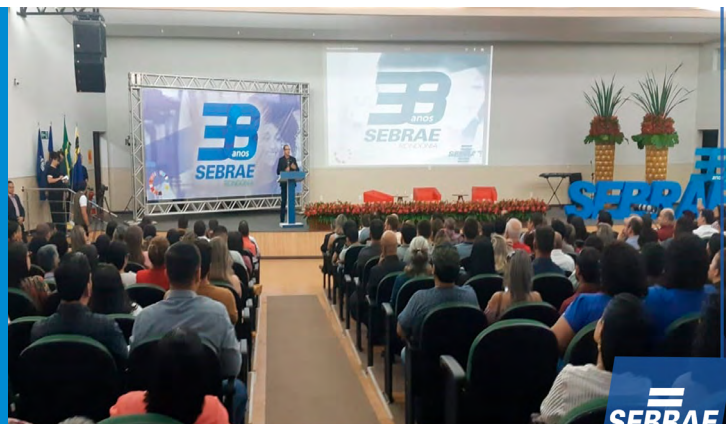
Aniversário 38 Anos Sebrae em Rondônia