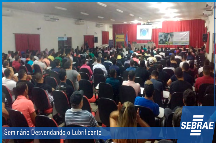
Seminário Desvendando o Lubrificante