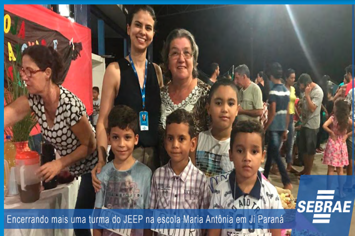
Encerrando mais uma turma do JEEP na escola Maria Antônia em Ji Paraná