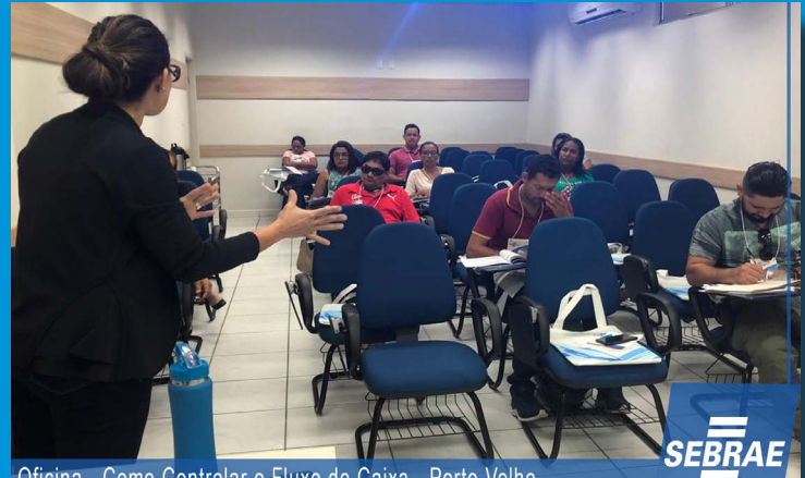
Oficina - Como Controlar o Fluxo de Caixa - Porto Velho