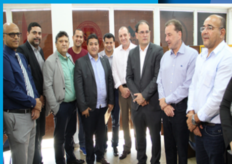
Sebrae inaugura Salas do Empreendedor em Porto Velho

Porto Velho-RO, Jun. e Jul. de 2019, Edição N° 43