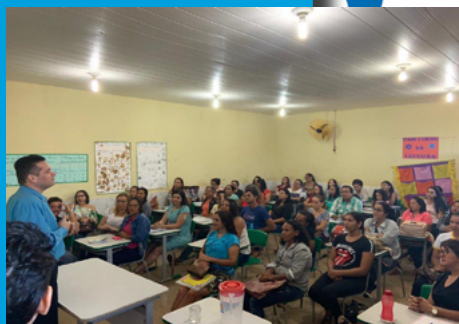
Educação Empreendedora nas escolas municipais de Vilhena