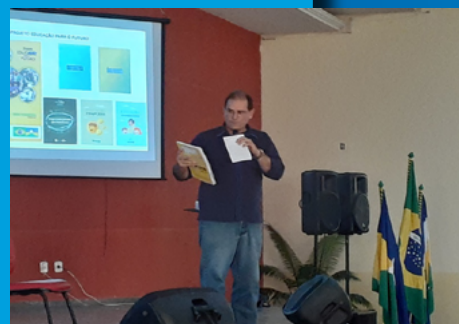
Superintendente do Sebrae/RO realiza palestra em Vilhena