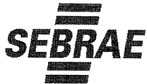
TABELA DE CLASSIFICAÇÃO DO CONVITE n.º 002/2015 – CONTRATAÇÃO DE EMPRESA ESPECIALIZADA EM PRESTAÇÃO DE SERVIÇOS DE CONSTRUÇÃO CIVIL PARA REALIZAÇÃO DA PINTURA E PEQUENOS REPAROS NO PRÉDIO DA SEDE DO SEBRAE-TO